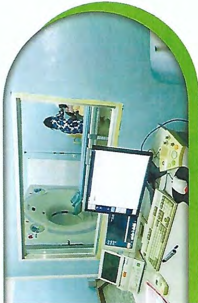
Salle de Scanner