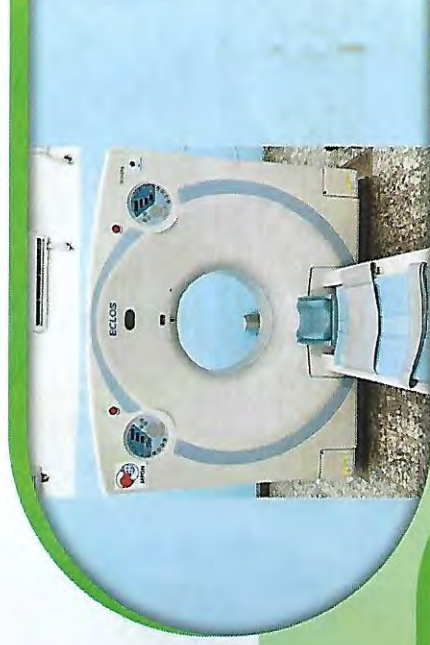
Couloir du Département de Radiologie et Imagerie médicale

Un Département de nouvelle génération, innovant, focalisé sur l'amélioration continue de la qualité et de la sécurité des soins aux patients ; en misant sur une recherche résolument tournée vers l'avenir et ouverte sur le monde.